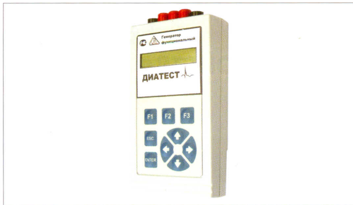
Рис.2. Прибор "Диатест"

улучшенный и модернизированный вариант 51-го семейства микроконтроллеров. Характеристики устройства таковы: 10-разрядный АЦП; 16 однополюсных или 8 дифференциальных каналов; входные диапазоны напряжений: \pm 5В , \pm 1В , \pm 0,5В , \pm 0,1В ; запуск АЦП: программный, внешний. При этом цена устройства – всего 3000 рублей.