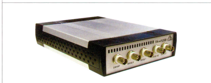
Рис.5. Высокочастотный преобразователь аналоговых сигналов ЛА-н1USB

структуру. Такой подход значительно сокращает время появления новых разработок. Еще одна функция микроконтроллера СУ7С68013 в этих устройствах – это калибровка. В ПЗУ микроконтроллера хранятся индивидуальные для каждого устройства подстроечные коэффициенты. Микроконтроллер использует эти подстроечные коэффициенты для того, чтобы согласовать диапазон входного сигнала с уровнем или амплитудой сигнала синхронизации. Это позволяет повысить точность измерений и автоматизировать процесс калибровки приборов.