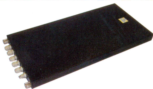
Рис.1. Преобразователь температуры РШ2816

В преобразователе аналоговых сигналов ЛА-50USB (рис.4) используется микроконтроллер фирмы Silicon Labs C8051F320 –