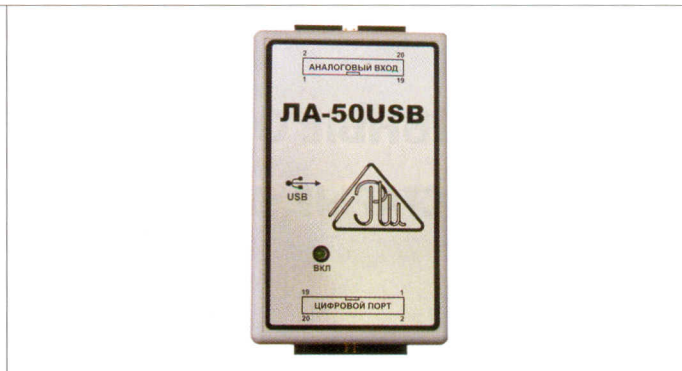
Рис.4. Преобразователь аналоговых сигналов ЛА-50USB